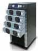
Масштабируемость и горячая замена