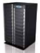
100-120 kVA + Батарейный кабинет