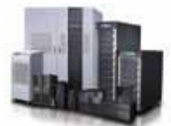
Delta предлагает полномасштабные решения с ИБП мощностью от 0,6 до 4000 кВА, удовлетворяющие любые потребности в бесперебойном питании.